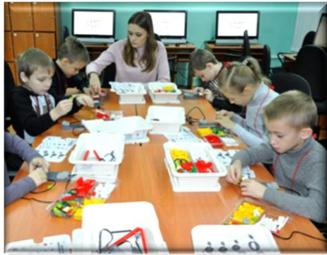
Лаборатория мобильной робототехники

проект «Мобильный Педагогический ЛабораториУм»