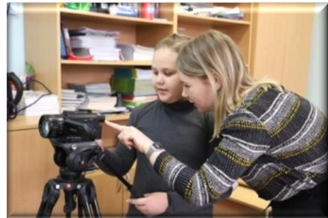
Фото- и видеолаборатория

проект «Мобильный Педагогический ЛабораториУм»